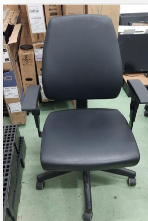
Figura 5. Cadeira giratória