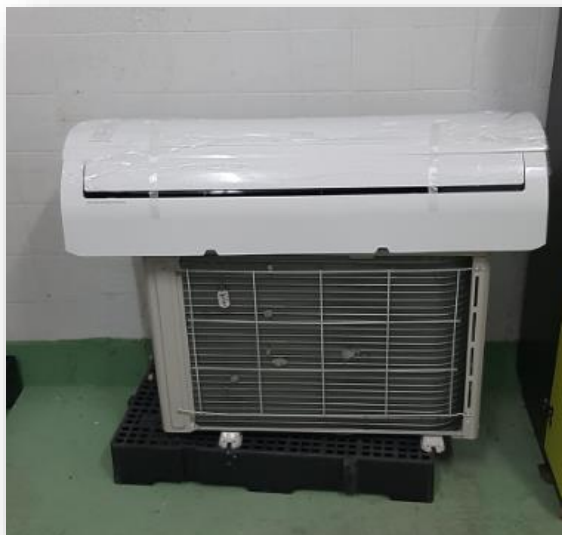
Figura 4. Ares-condicionados: 12000; 18000; 24000; 36000 BTUS

Ares-condicionados: 12000; 18000; 24000; 36000 BTUS: Empenhados em 2022 e entregues em 2023, possibilitaram a substituição de ares-condicionados antigos e/ou danificados, proporcionando conforto térmico aos usuários internos e externos.