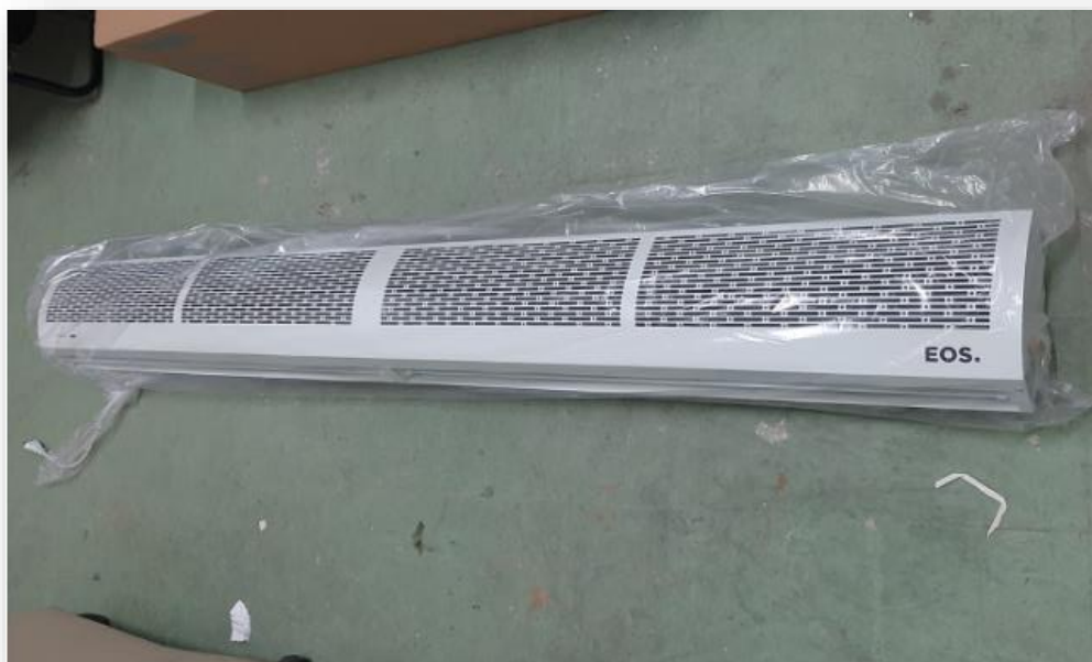
Figura 3. 04 Cortinas de Ar, 200cm, 220v

Para climatização da recepção do CAESE, trazendo conforto térmico para os pacientes que aguardam atendimento nos ambulatórios.