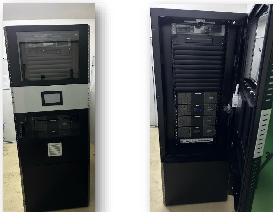
Figura 16 – Aquisição de microdatacenter

Com esta aquisição, os sistemas de informação do HUAC como: AGHU, SisHUAC, GLPI, PACS, Kanban, Documentação, SGA, entre outros passarão a ter os equipamentos que os hospedam abrigados neste ambiente adequado. Com isso, eles estarão mais seguros e menos suscetíveis a indisponibilidades e falhas.