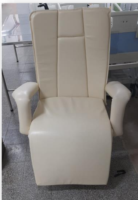
Figura 7. Poltronas reclináveis para acompanhantes

- Substituição de poltronas danificadas, trazendo mais conforto e dignidade e humanização no atendimento aos acompanhantes dos pacientes.