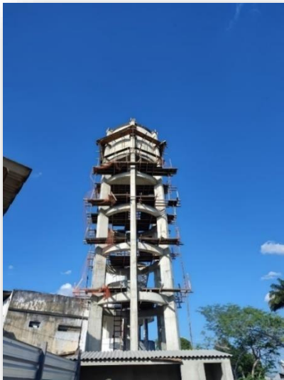
Figura 13 – Obra do Sistema de Combate a Incêndio.