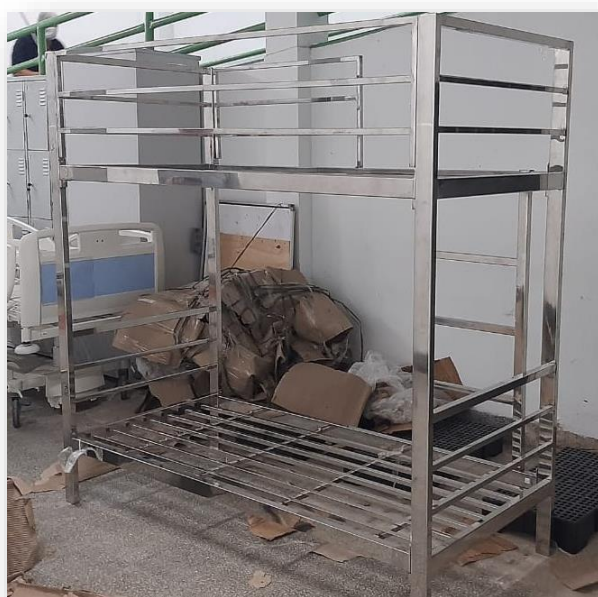
Figura 8. Camas Beliches

12 camas beliche totalmente em aço inox AISI 304, material extremamente durável, possibilitará a substituição das beliches danificadas nos repouso dos funcionários do HUAC, proporcionando segurança e dignidade aos profissionais