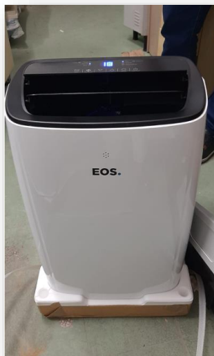
Figura 2. Ar-condicionado portátil 12000 Btus

Possibilitar uso em locais de difícil instalação dos ares-condicionados convencionais ou em uso provisório nos locais em que o convencional está em manutenção, garantindo conforto térmico aos usuários.