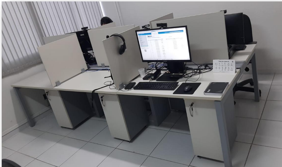
Figura 6. Estações de trabalho

Empenhos: 2022NE001508; 2022NE001723 E 2022NE001801