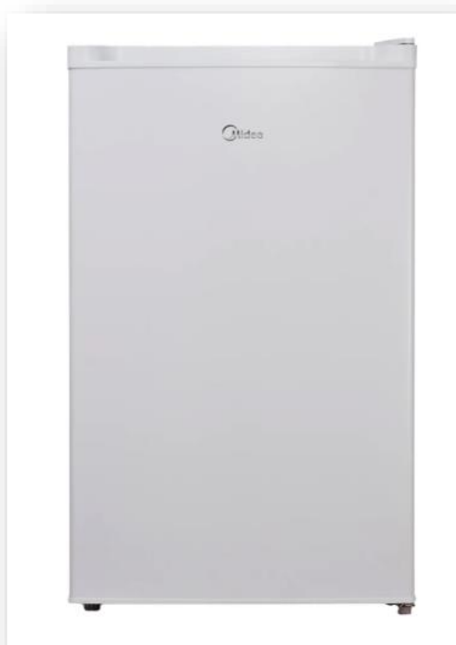
Figura 1. Frigobar 120 Litros, 220V, cor branca