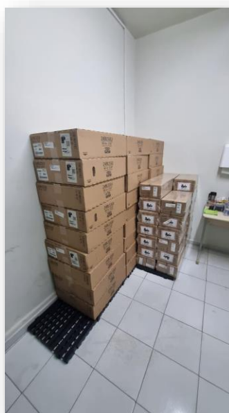
Figura 17 – Aquisição de novos computadores

A aquisição de computadores serviu para aumentar o parque em virtude da contratação de novos colaboradores e ampliação do uso de sistemas nas rotinas hospitalares. Além da ampliação, também foram substituídos alguns computadores que possuíam mais de 8 anos de uso e estavam apresentando recorrentes problemas.