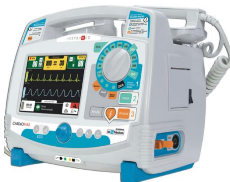
Figura 1. Cardioversor/Desfibrilador