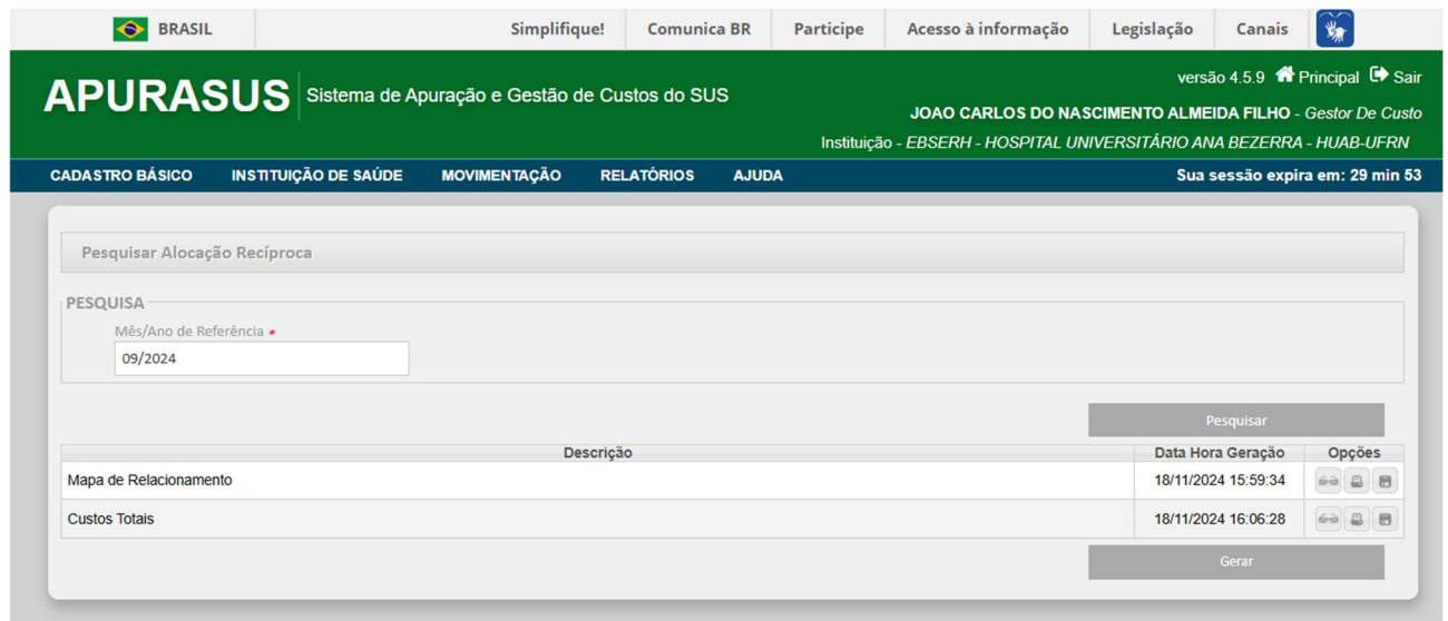
Figura 01 - Alocação recíproca

Concluída a alocação recíproca, conforme Figura 01, o Setor de Contabilidade (SCONT) estará apto a extrair os relatórios no Sistema APURASUS.