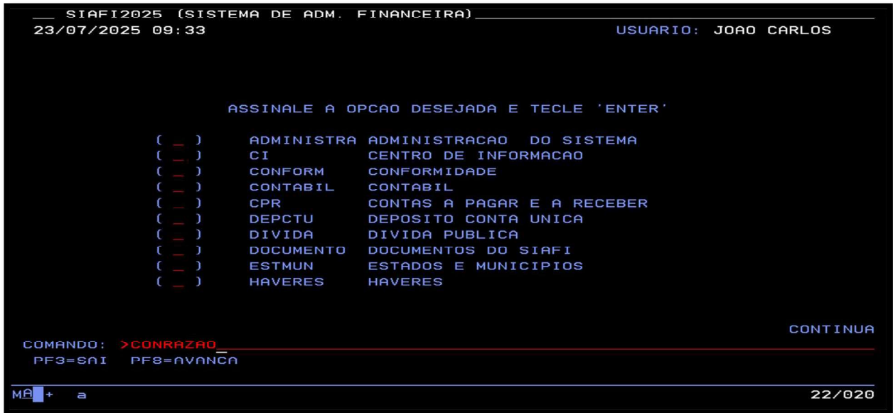
Figura 05 – Tela de acesso ao CONRAZAO

3.3. Na tela seguinte, Figura 05, na linha COMANDO digitar a transação >CONRAZAO, teclando Enter :