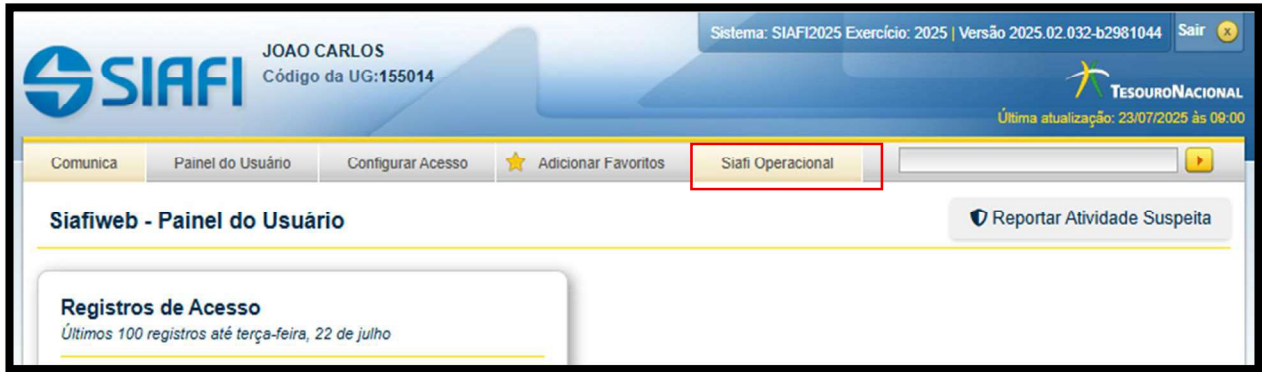
Figura 01 – Página de acesso ao Siafi Operacional