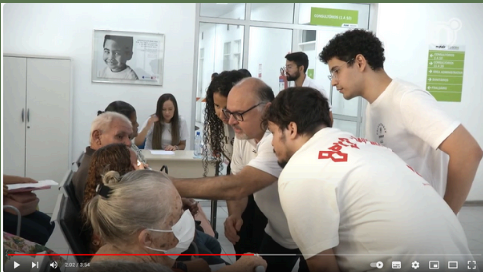
Mutirão de combate ao glaucoma acontece na Policlínica