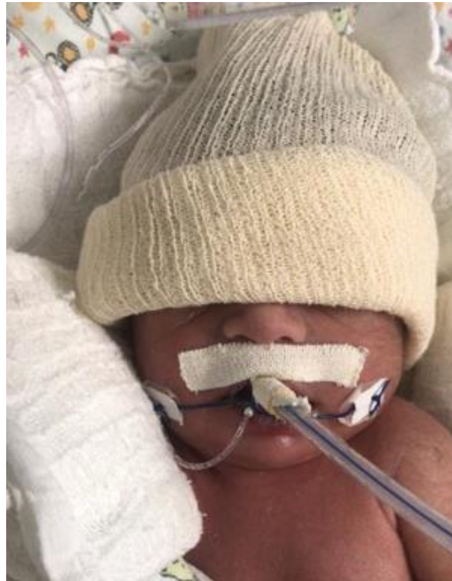
Figura 2 - Fixação de TOT com bandagem elástica adesiva.