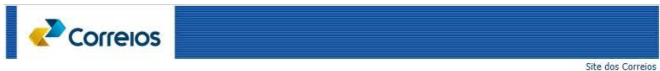
Figura 2 – Site do sistema de logística reversa dos Correios após lançamento do código administrativo.