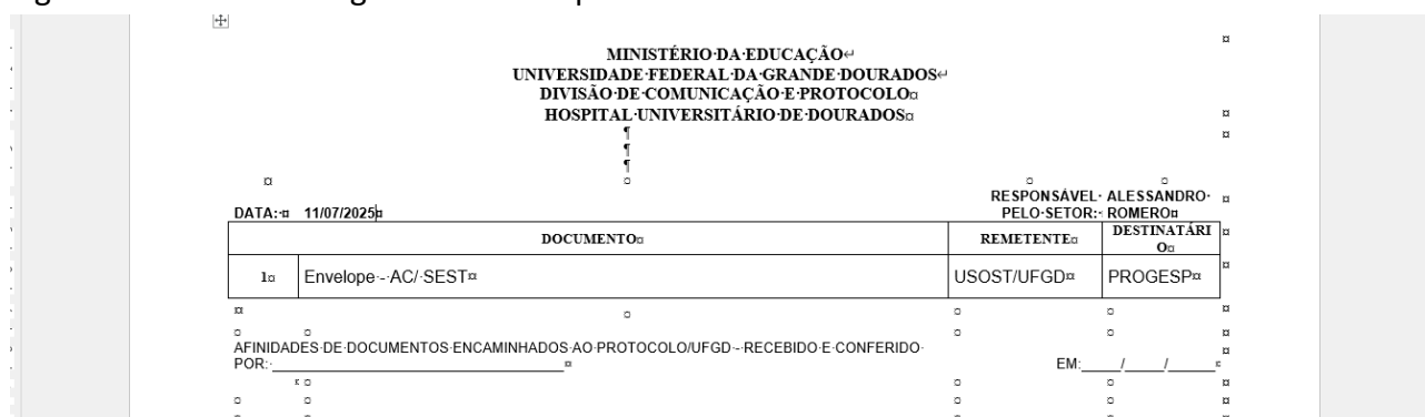
Figura 3 – Localizar o registro de correspondências