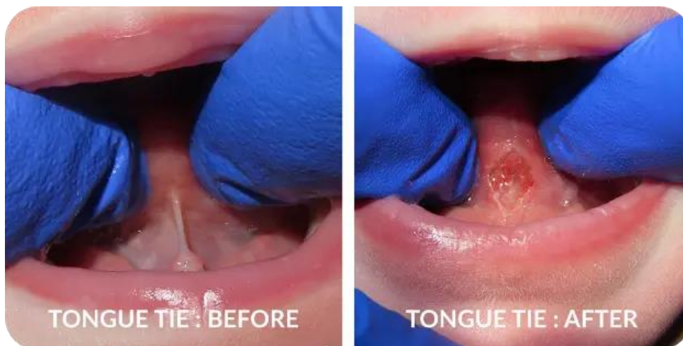
Figura 1 - Aspectos Clínicos do Frênulo Lingual: Antes e Depois da Liberação ( Tongue Tie ).