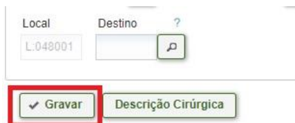
Figura 6 – Gravando horários.