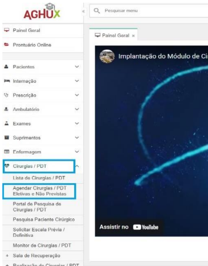
Figura 1 – Seleção do campo de agendamento de cirurgias.