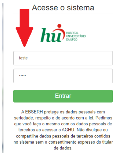
Figura 2 - Autenticação de login no AGHUX.