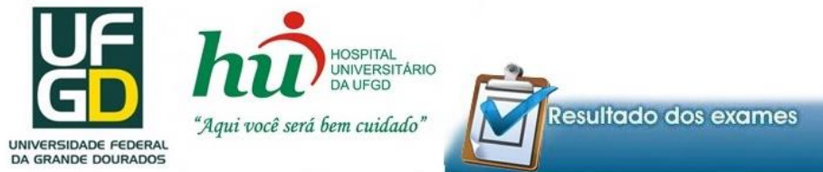
Figura 2 – Tela de emissão de laudos on-line.

Observação: Cada posto de saúde possui seu código e só conseguirá acessar os resultados através desse código.