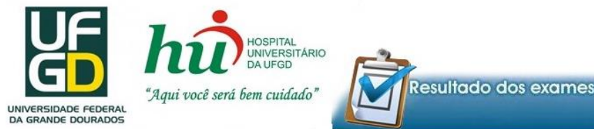
Figura 3 - Tela de emissão de laudos on-line para UBS.