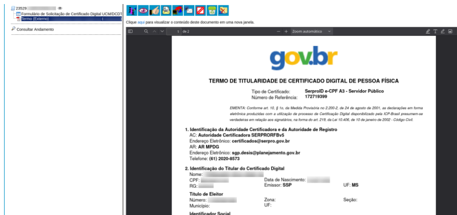
Figura 2 – Termo de titularidade de certificado digital.

Fonte: print de tela realizada pelo autor.