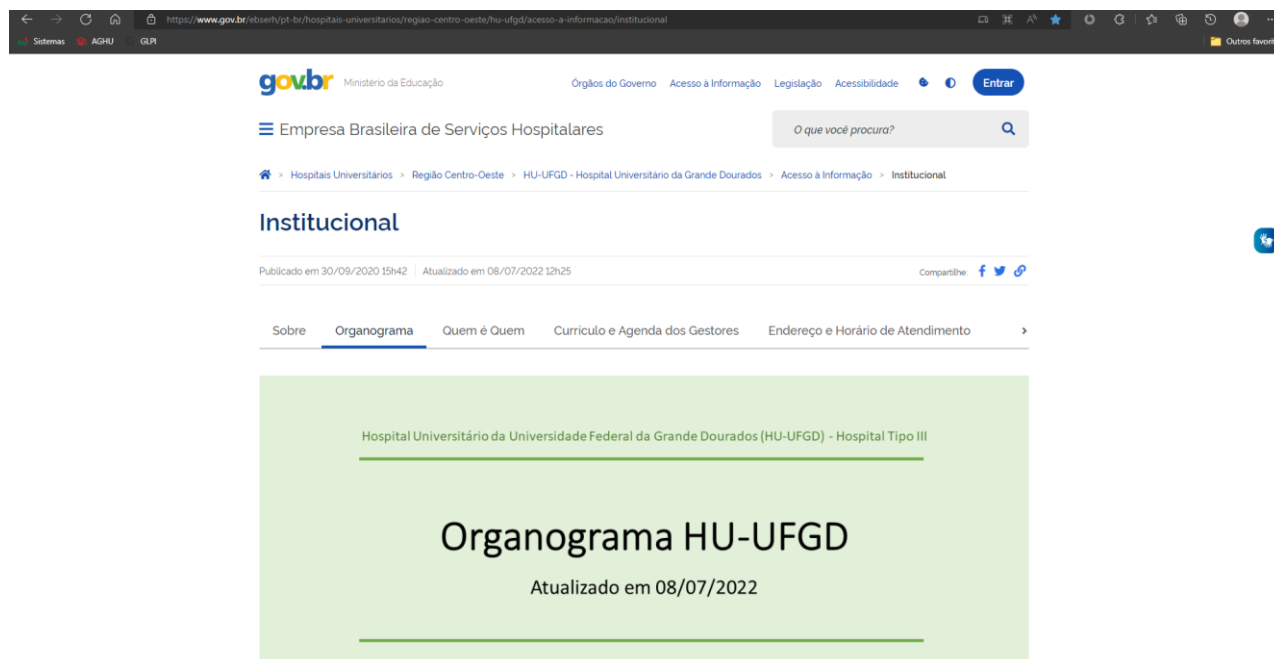
Figura 1 – Acesso ao organograma institucional.