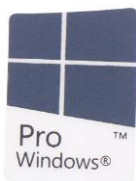
Figura 2 – Etiqueta Pro Windows.