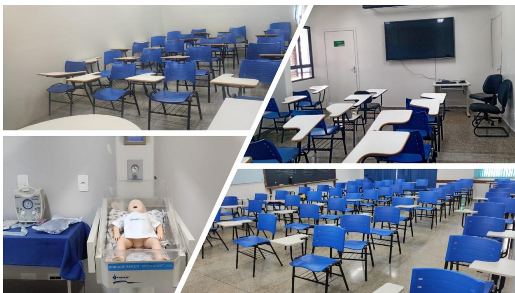
Figura 1 - Espaços de ensino.