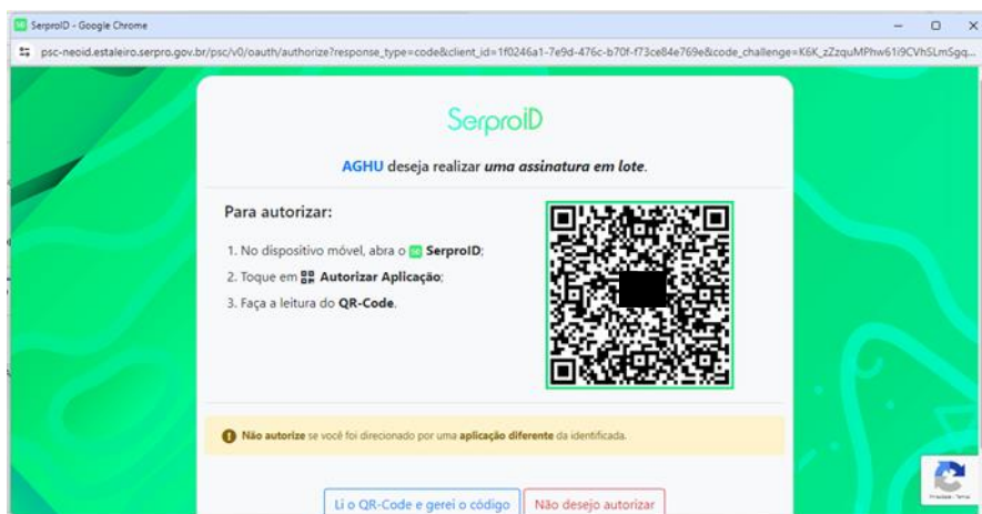
Figura 03 - Leitura do QR code para assinatura digital