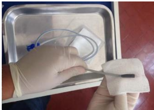
Figura 3 - Lubrificação da SNE.