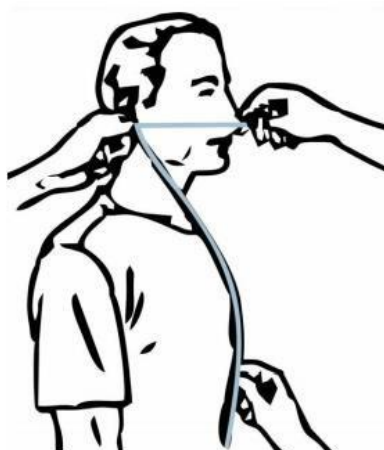
Figura 2 - Medição da SNE.