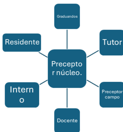
Figura 2 - Preceptor núcleo sendo satélite para outros atores.