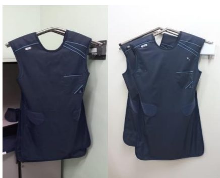
Figura 4 – Aventais plumbíferos.