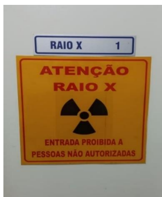
Figura 1 – Símbolo de radiação.