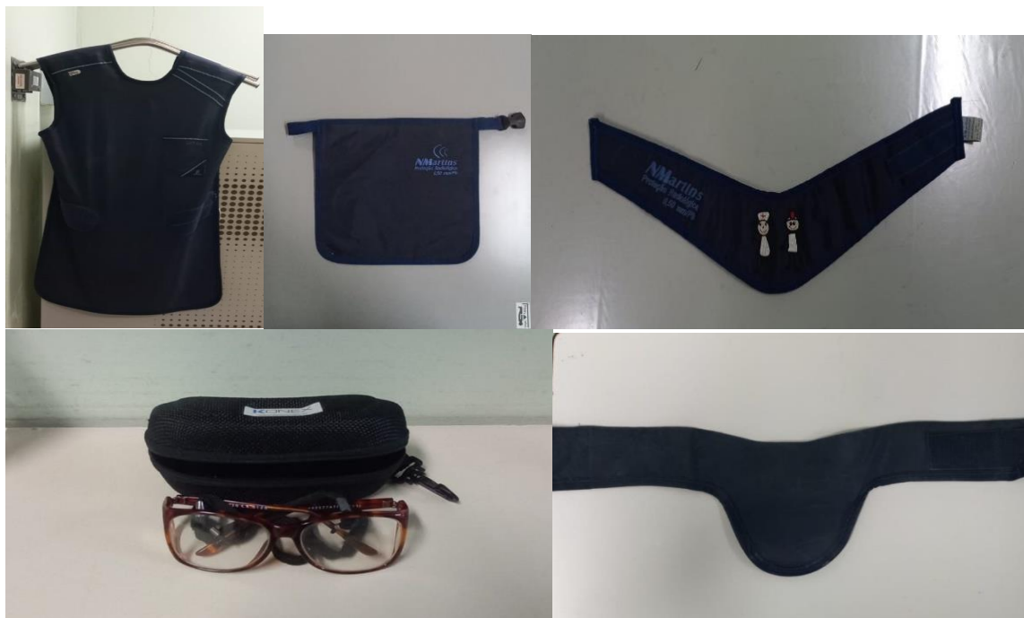
Figura 5 – Equipamentos de proteção.

Para proteger as regiões do corpo do paciente que não serão radiografadas são disponibilizados equipamentos de proteção individual, ilustrados a seguir: