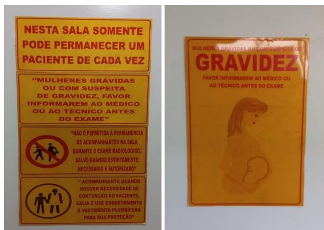
Figura 3 – Mensagens e avisos.