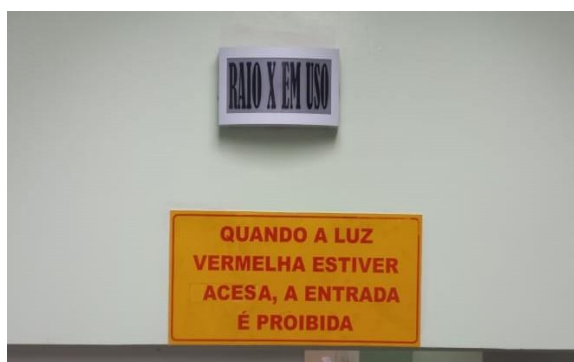
Figura 2 – Sinalização luminosa.