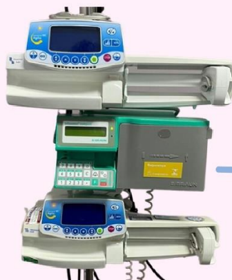
Bomba de infusão

Fototerapia – É uma luz que seu bebê pode necessitar se apresentar coloração amarelada, chamada de icterícia. Durante o tratamento o bebê irá usar uma proteção nos olhos, para impedir exposição prolongada da luz, e essa luz será emitida por um equipamento chamado Bilitron.