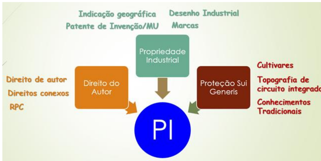
Figura 1. Propriedade intelectual.