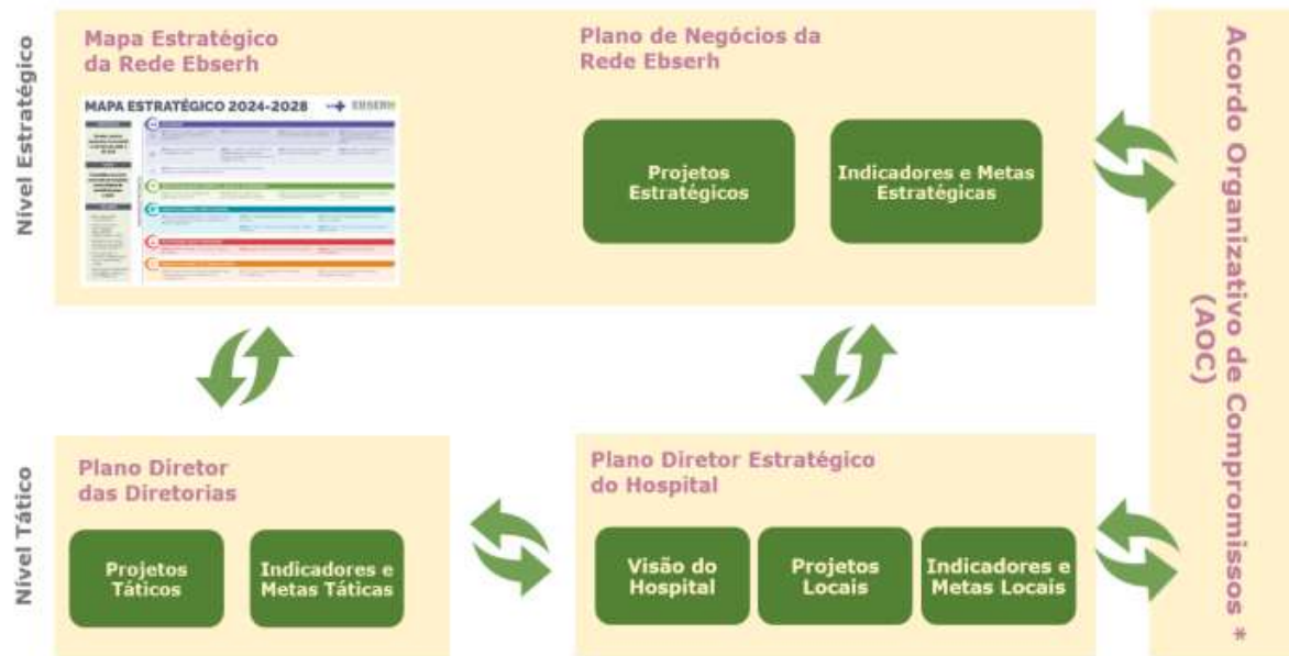
Figura 3: Modelo de Desdobramento da Estratégia da Rede Ebserh.