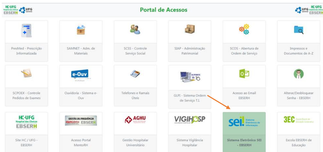
Figura 4. Acessar SEI