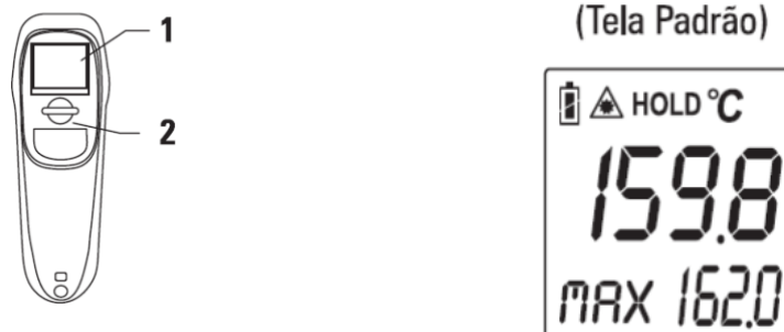
Figura 2. Interpretação da leitura do termômetro