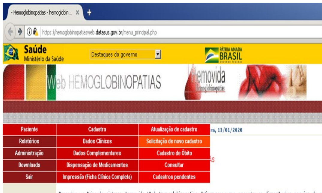
Figura 1. Cadastro dos pacientes