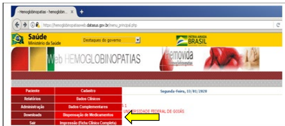
Figura 3. Dispensação de medicamentos.