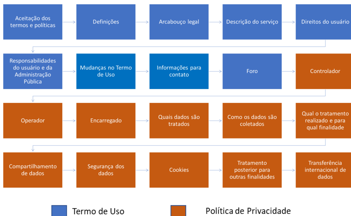
Figura 1 – Tópicos do Termo de Uso e da Política de Privacidade

Organizou-se este Guia em tópicos, que deverão constar no documento final do Termo de Uso. Cada tópico contém uma descrição e um campo com as informações que devem constar em cada um deles. Os tópicos apresentam referências ao Guia de Boas Práticas da LGPD 2 , elaborado pelo Comitê Central de Governança de Dados, instituído pelo Decreto 10.046, de 9 de outubro de 2019, de modo a ajudar na compreensão e aprofundamento dos temas tratados.