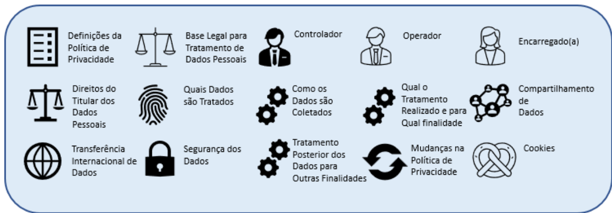
Figura 2. Tópicos da Política de Privacidade

A Política de Privacidade cumpre, fundamentalmente, o dever de transparência disposto como princípio na LGPD, tendo como objetivo descrever ao titular dos dados pessoais, os procedimentos e processos adotados no tratamento de dados pessoais realizado pelo serviço, bem como informá-lo sobre as medidas de proteção de dados pessoais adotadas.