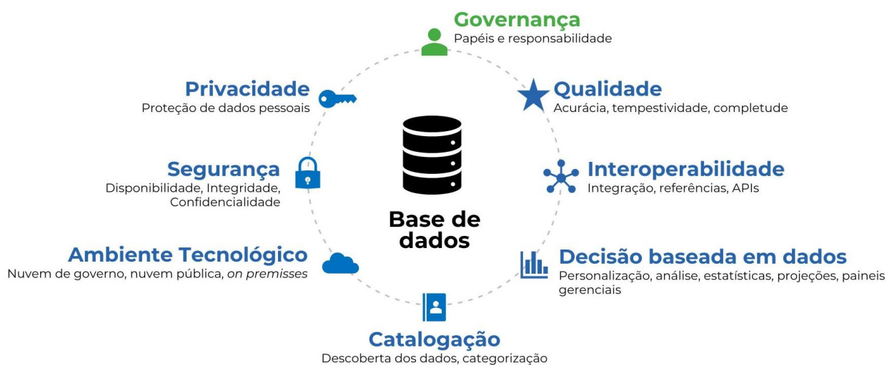
Figura 1 - Infraestrutura Nacional de Dados

eixos da Infraestrutura Nacional de Dados. Ao estabelecer diretrizes, papéis, responsabilidades e processos estruturados, a governança viabiliza que os dados sejam tratados e utilizados de forma coordenada, legal, ética, segura e eficiente. Dessa maneira, constitui o alicerce que sustenta o uso estratégico de dados no setor público e permite transformar informações dispersas em ativos de alto valor para a sociedade.