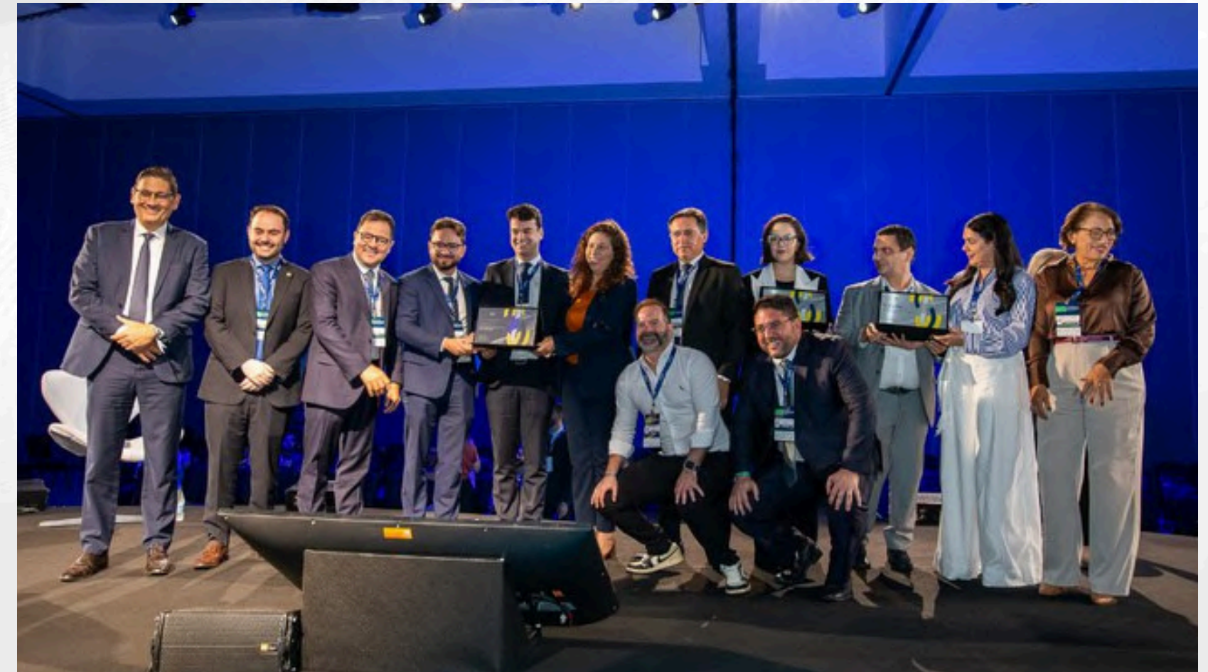
Ministra Esther Dweck no XIV Congresso Consad de Gestão Pública, discutindo inovação e cooperação federativa.

Ao todo, em 2025 foram firmados 28 novos acordos de adesão: 15 estados (Acre, Alagoas, Amapá, Ceará, Espírito Santo, Mato Grosso, Mato Grosso do Sul, Maranhão, Minas Gerais, Pernambuco, Rio Grande do Sul, Rondônia, Roraima, Sergipe e Tocantins.) e 13 municípios (Aracaju/SE, Belém/PA, Campo Grande/MS, Contagem/MG, Feira de Santana/BA, João Pessoa/PB, Juiz de Fora/MG, Niterói/RJ, Palmas/TO, Porto Velho/RO, Recife/PE, Rio de Janeiro/RJ e Serra/ES). Agora, são 19 estados e 13 municípios , promovendo boas práticas de cooperação federativa e desenvolvendo as capacidades para a inovação na gestão pública .