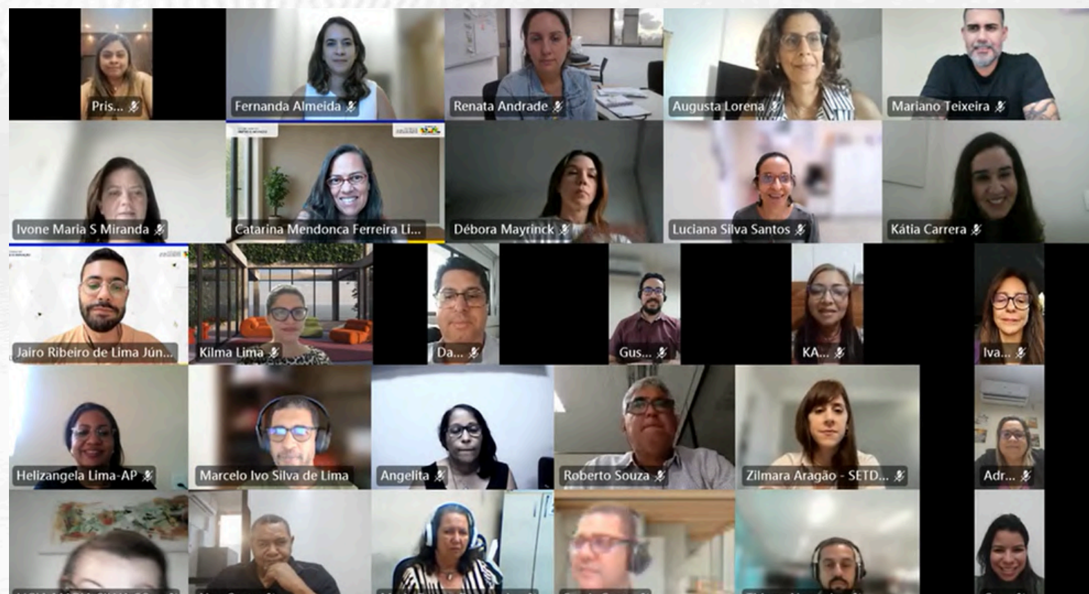
Oficina com o LA-BORA!gov e gerentes e participantes do PNGI.

LA-BORA!gov: AP - BA - CE - PE Belém/PA João Pessoa/PB