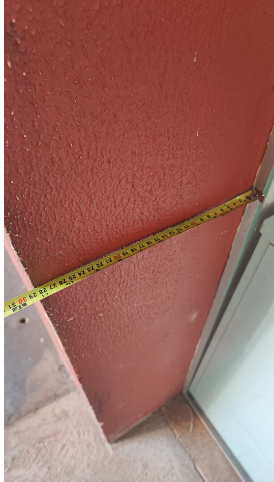
Largura do vão externo da Gerência

SUPERINTENDÊNCIA REGIONAL DE ADMINISTRAÇÃO DO MGISP NO PR