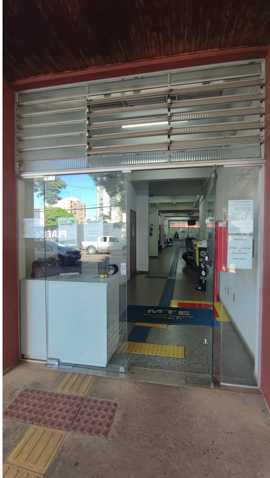
Lado externo da Gerência