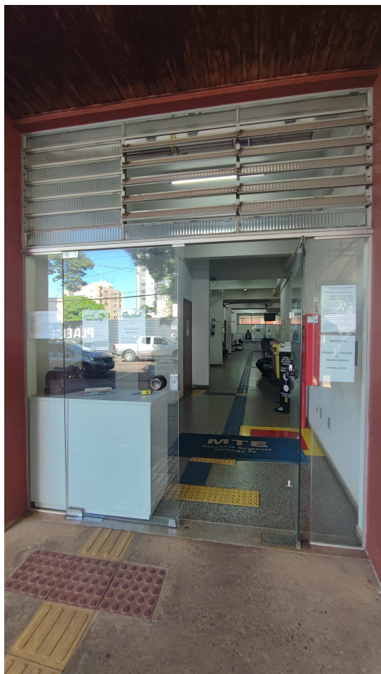
Lado externo da Gerência

MINISTÉRIO DA GESTÃO E DA INOVAÇÃO EM SERVIÇOS PÚBLICOS Secretaria de Gestão Corporativa Superintendência Regional de Administração no Paraná Divisão de Administração e Logística Área de Engenharia