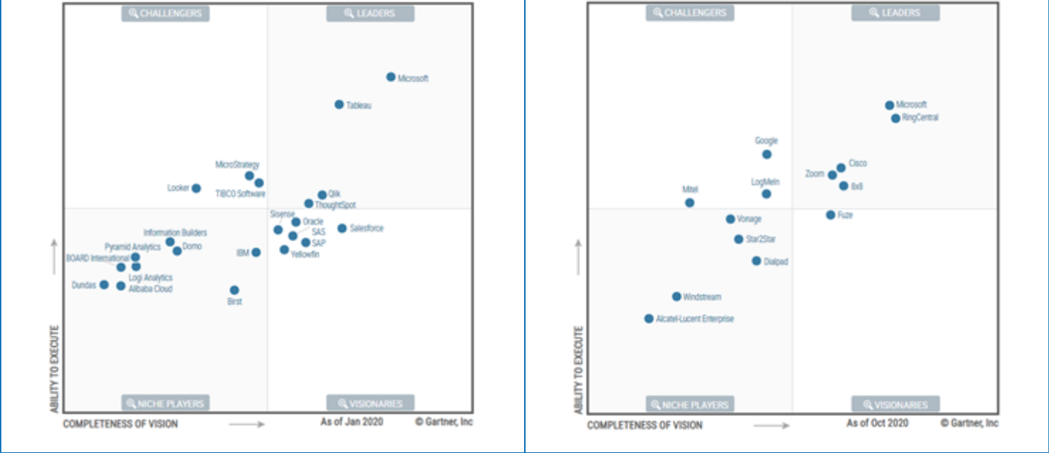
QUADRO 3: POSICIONAMENTO DE SOLUÇÕES MICROSOFT (FONTE: GARTNER).