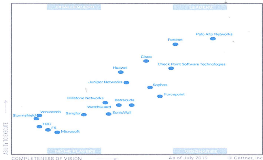
Figure 1. Magic Quadrant for Network Firewalls

Vale ressaltar que as soluções de Next Generation Firewall da fabricante Palo Alto Networks, representada por esta impugnante nesse processo, são considerados no mercado nacional e internacional, líder tecnológico no segmento de firewall de próxima geração e segurança da informação, posição consolidada há vários anos consecutivos e endossado pelo Gartner, empresa de consultoria mencionada pela FUNASA no Termo de Referência, item 3.1.4.