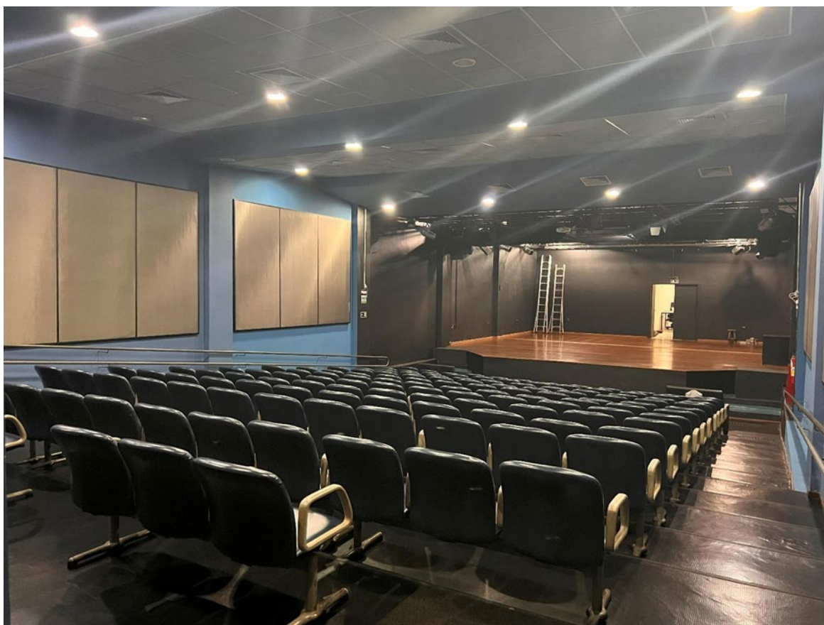
Interior do Galpão 01