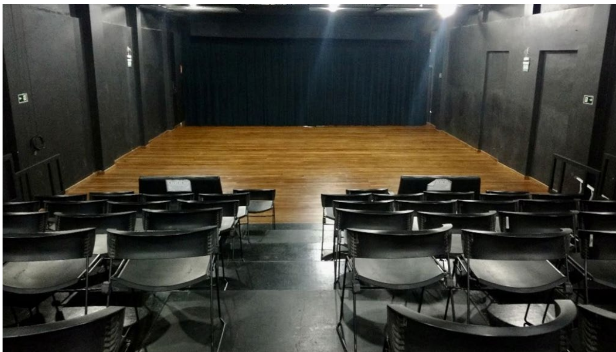
INTERIOR DO GALPÃO 03