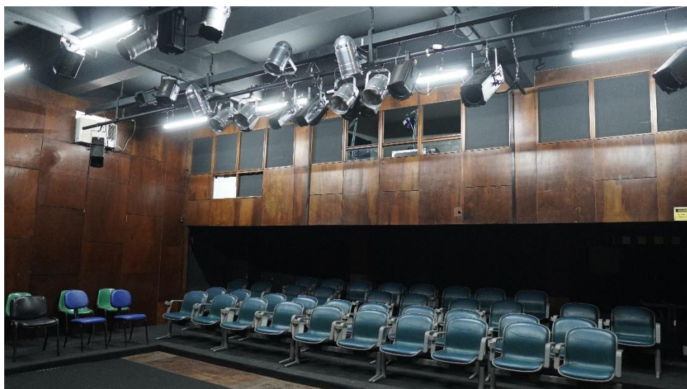
Vara de iluminação cênica – 1