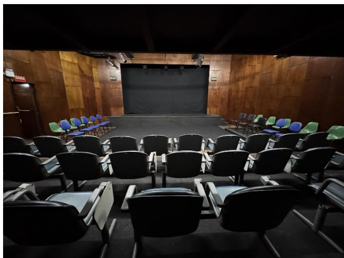
Ponto de vista da plateia