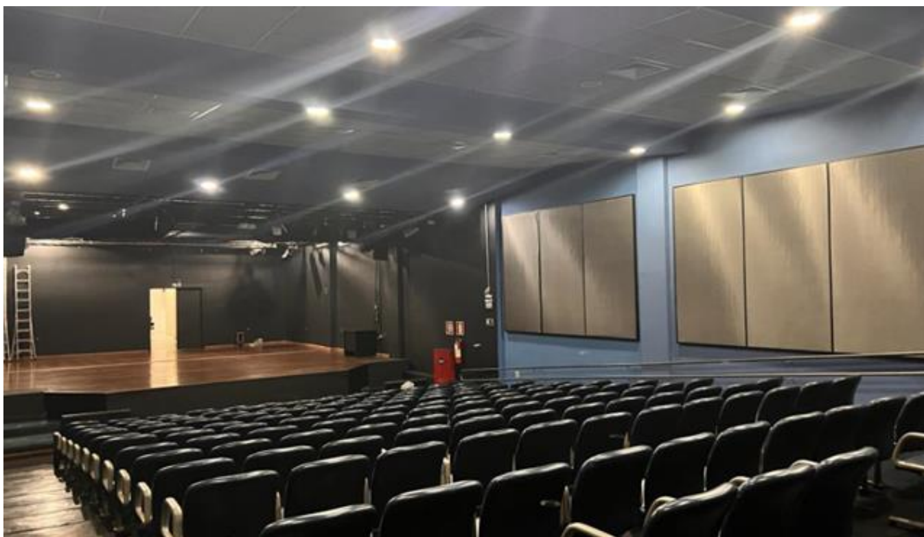
INTERIOR DO GALPÃO 01