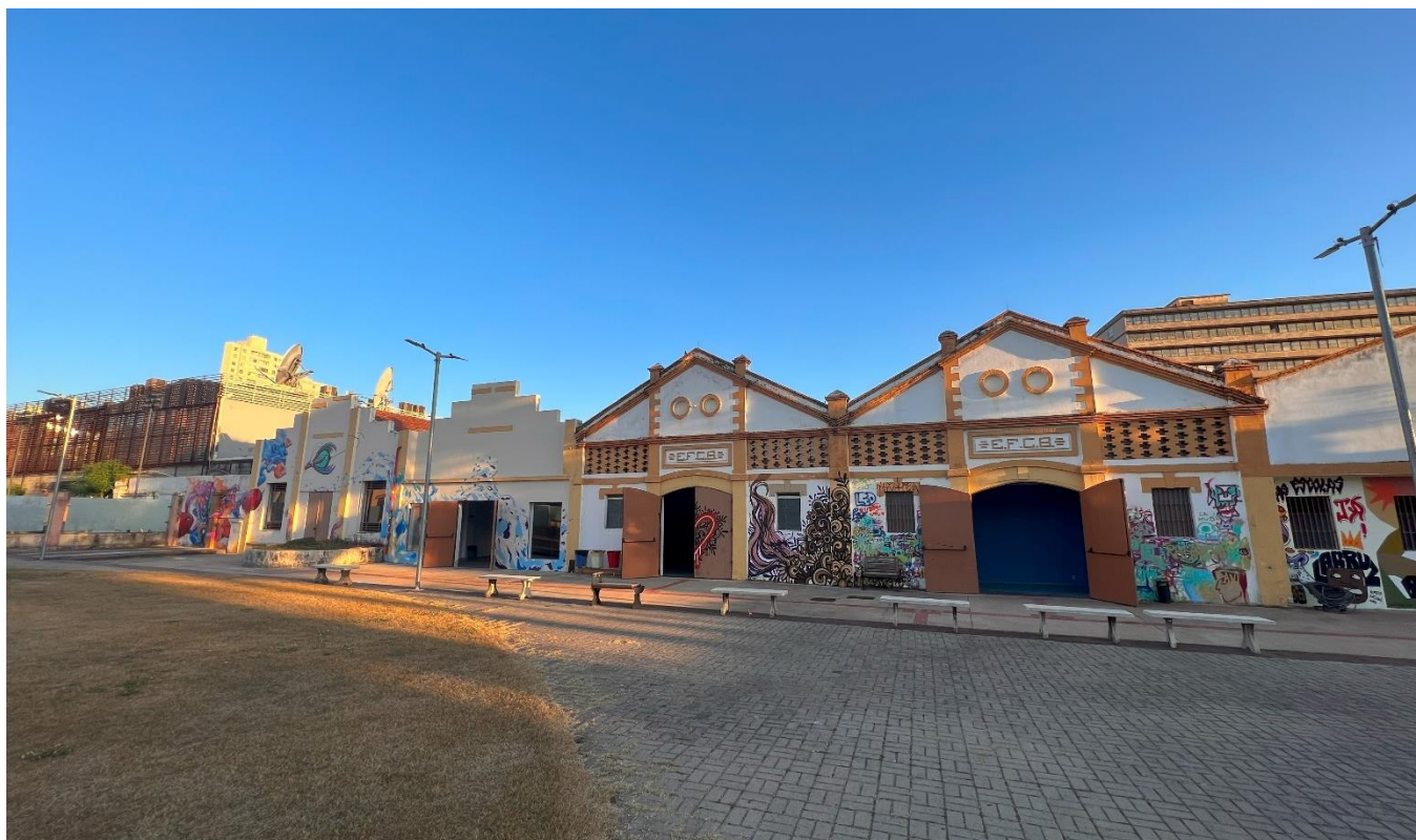
IMAGEM DA FACHADA DOS GALPÕES