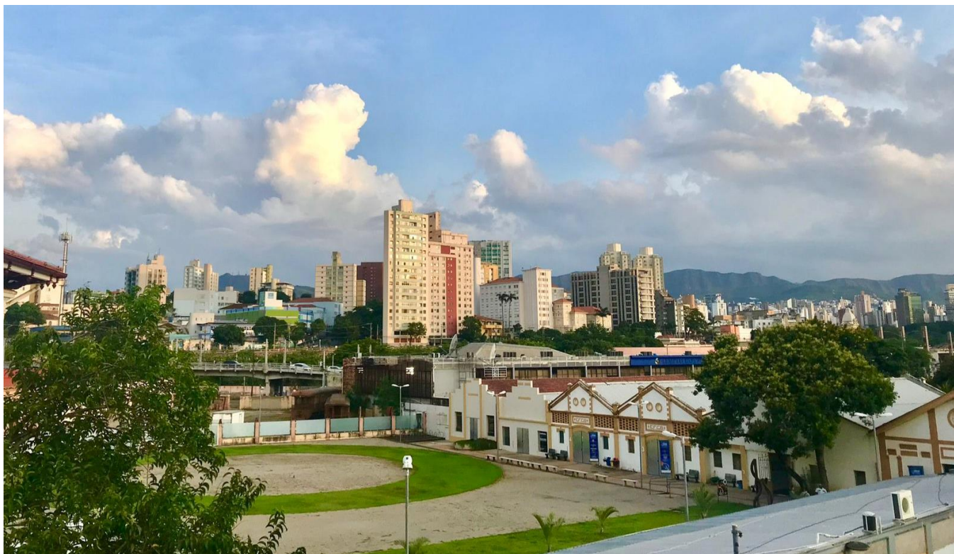
IMAGEM AÉREA DO COMPLEXO