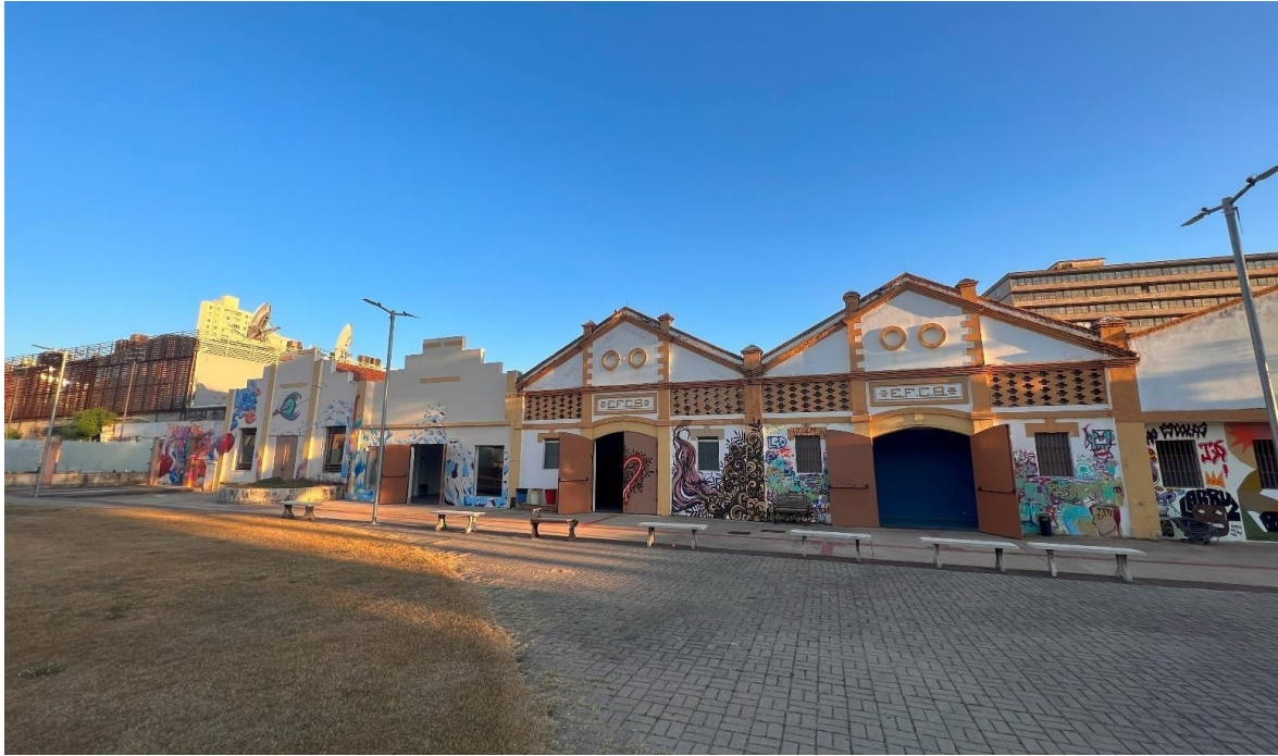
IMAGEM DA FACHADA DOS GALPÕES