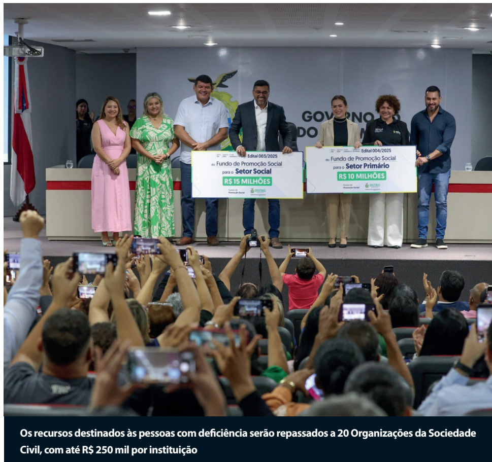
Os recursos destinados às pessoas com deficiência serão repassados a 20 Organizações da Sociedade Civil, com até R$ 250 mil por instituição

As OSCs poderão apresentar propostas que incluam aquisição de equipamentos, materiais e bens móveis, adequação de espaço físico, contratação de equipe essencial e serviços especializados. Instituições que atuam com servi-