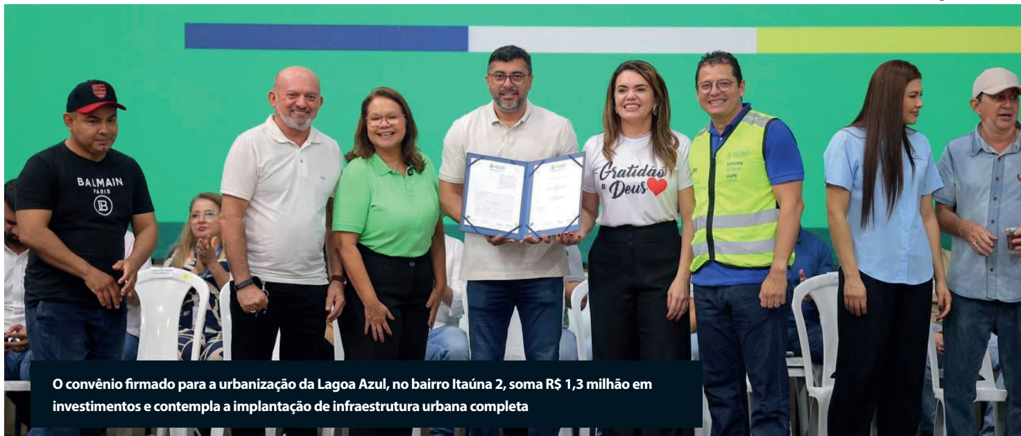
O convênio firmado para a urbanização da Lagoa Azul, no bairro Itaúna 2, soma R$ 1,3 milhão em investimentos e contempla a implantação de infraestrutura urbana completa