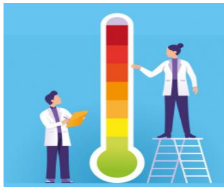
Figura 2 - Ponderação 17

58. Desta forma, uma infração leve, a qual resulta numa advertência, não atingiu, por dedução lógica, o “grau” necessário para receber uma suspensão. Assim, a ofensa leve, que teve como consequência uma advertência, recebeu, necessariamente, uma avaliação cujos valores resultaram num nível inferior que o de uma suspensão.