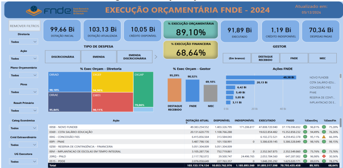
Figura 1 - Execução Orçamentaria

O Fundo Nacional de Desenvolvimento da Educação (FNDE), criado pela Lei nº 5.537, de 21 de novembro de 1968, é a Autarquia Federal responsável pela execução das principais ações educacionais do Ministério da Educação (MEC) – sobretudo, no campo da educação básica – devido à sua competência de efetivação das transferências financeiras a todos os Estados, Municípios e Distrito Federal. No cumprimento de sua missão, parte significativa dos repasses observa o modelo de execução descentralizada, como se observa na figura a seguir: