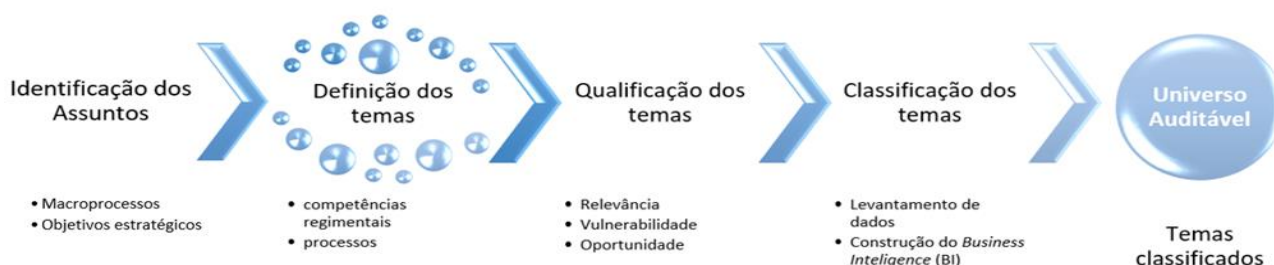
Figura 3 Metodologia de identificação e análise do universo auditável.

O universo auditável abrange as unidades organizacionais, processos, sistemas, programas, projetos, atividades passíveis de avaliação, podendo ser delimitado sob diversas perspectivas. No contexto do Paint, o universo auditável encontra-se abalizado por temas relevantes passíveis de serem abordados no exercício seguinte. A figura abaixo esquematiza o processo de identificação e classificação dos temas auditáveis adotado na Audit.