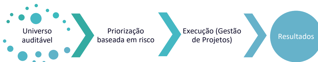
Figura 4 Fluxo do planejamento da Audit do FNDE.

A classificação e a priorização dos temas definidos no âmbito do mapeamento do universo auditável constituem elemento basilar para as ações de planejamento da Auditoria Interna, cujas análises consideram as etapas que fazem parte da metodologia e o seguinte fluxo: