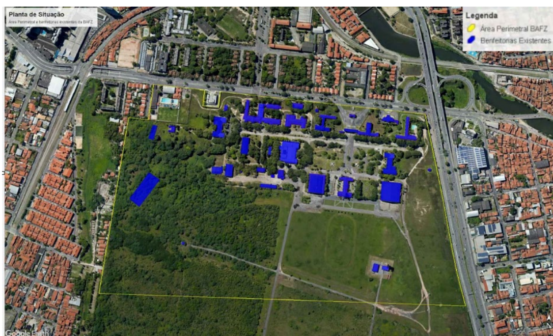
Figura 3: Área Militar – Base Aérea de Fortaleza

Conforme dados obtidos do Sistema de Obras e Patrimônio (SISOP), a área da BAFZ hoje é de 5.136.103,42 m 2 , abrangendo a área delimitada na figura 3: