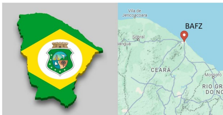
Figura 1: Localização da Base Aérea de Fortaleza

A Base Aérea de Fortaleza (BAFZ) está localizada na cidade de Fortaleza-CE, especificamente na Avenida Borges de Melo, 205 - CEP 60415-513 Fortaleza – CE.