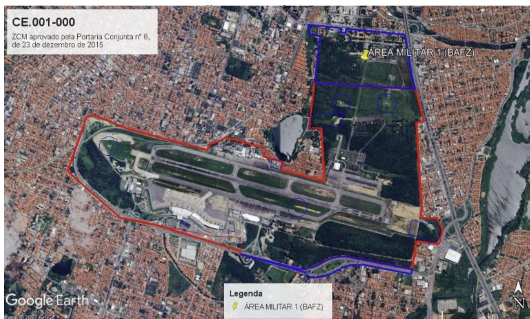
Figura 2: Tombo CE.001-000

Sua área patrimonial é parte do tomo CE.001-000, que abriga o Aeroporto do local (área civil), BAFZ e DTCEA-FZ, conforme figura 2.