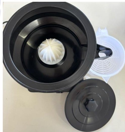
Espremedor/Extrator de Frutas cítricas – VITALEX – Modelo: ESS-I (Imagem superior - com componentes)