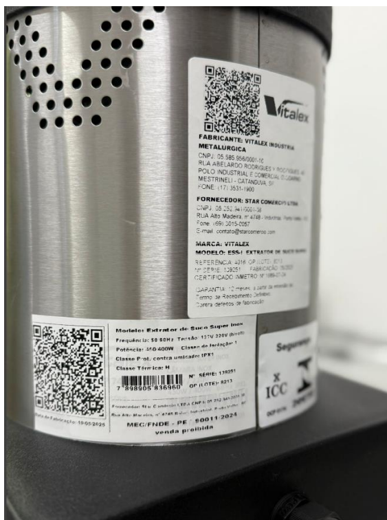
Espremedor/Extrator de Frutas cítricas – VITALEX – Modelo: ESS-I (etiquetas retificadas com nº de lote)

OBS: Caso os senhores entendam que as etiquetas devem ser fixadas em local diverso, alteramos a qualquer tempo.