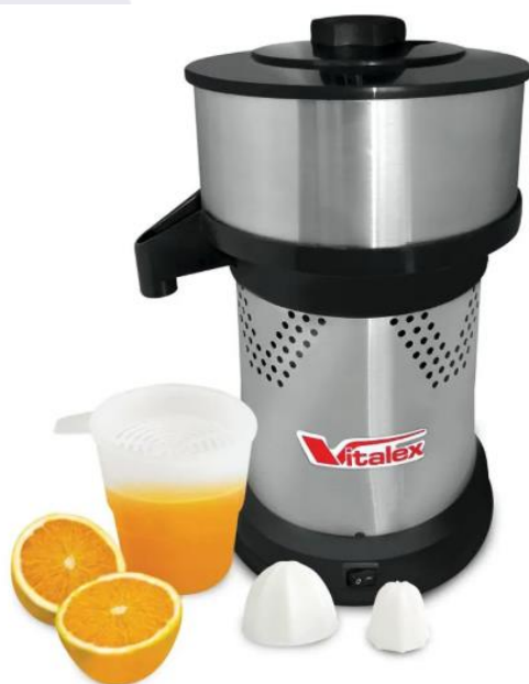
Espremedor/Extrator de Frutas cítricas – VITALEX – Modelo: ESS-I (com componentes)

OBS: Caso os senhores entendam que as etiquetas devem ser fixadas em local diverso, alteramos a qualquer tempo.