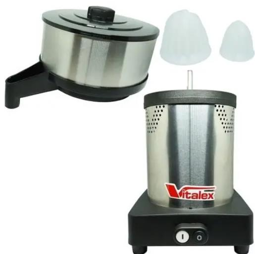
Espremedor/Extrator de Frutas cítricas – VITALEX – Modelo: ESS-I (Carambolas de limão e laranja)