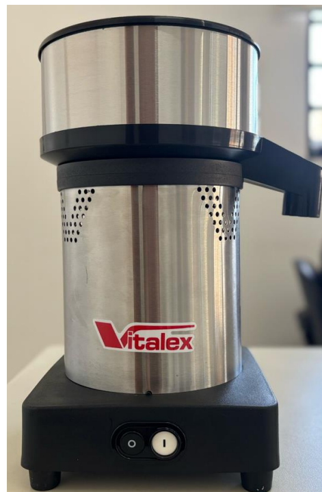
Espremedor/Extrator de Frutas cítricas – VITALEX – Modelo: ESS-I (Frontal).