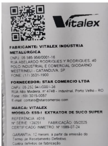
Etiqueta autoadesiva - Espremedor/Extrator de Frutas cítricas – VITALEX – Modelo: ESS-I