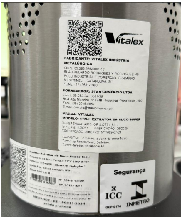
Espremedor/Extrator de Frutas cítricas – VITALEX – Modelo: ESS-I (Traseira). Com etiqueta retificada.