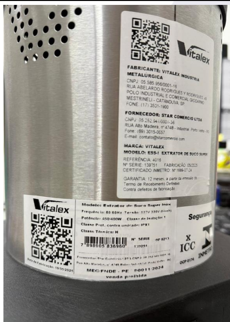
Espremedor/Extrator de Frutas cítricas – VITALEX – Modelo: ESS-I (posicionamento etiquetas)

OBS: Caso os senhores entendam que as etiquetas devem ser fixadas em local diverso, alteramos a qualquer tempo.