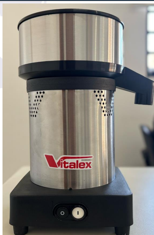
Espremedor/Extrator de Frutas cítricas – VITALEX – Modelo: ESS-I (Frontal).