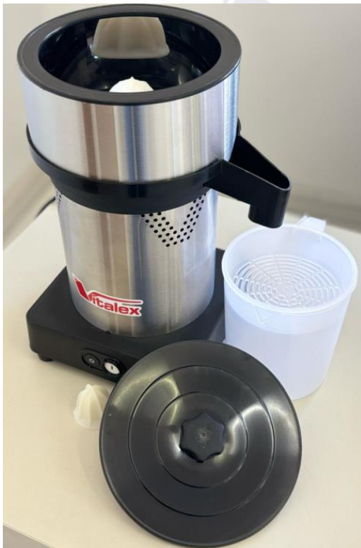
Espremedor/Extrator de Frutas cítricas – VITALEX – Modelo: ESS-I (com componentes)