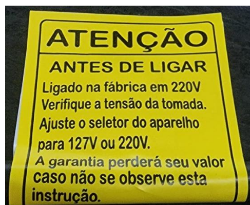
Foto etiqueta de indicação de Tensão (voltagem) no cordão de alimentação/rabicho do Espremedor/Extrator de Frutas cítricas – VITALEX – Modelo: ESS-I.