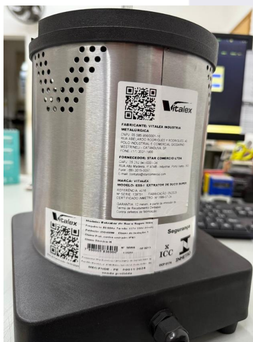
Espremedor/Extrator de Frutas cítricas – VITALEX – Modelo: ESS-I (Traseira).