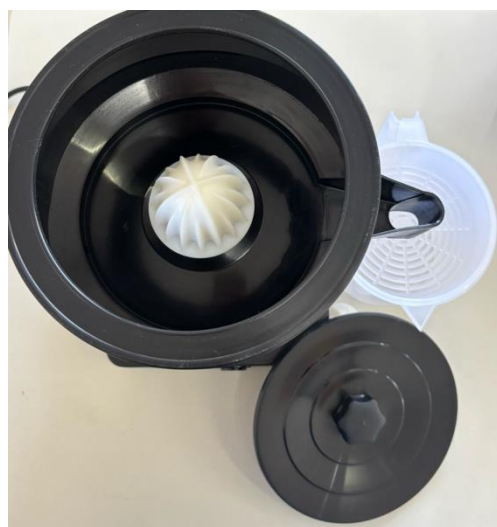
Espremedor/Extrator de Frutas cítricas – VITALEX – Modelo: ESS-I (Imagem superior - com componentes)