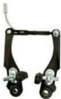
Figura 4 - Ilustração do freio V-brake.