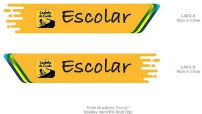
Figura 10 - Ilustração do capacete escolar.