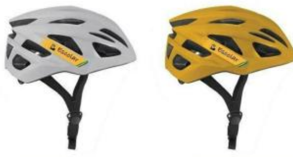
Figura 11 – Ilustração do capacete escolar com adesivos aplicados.

6.1.1.4. Os projetos de adesivos poderão ser ajustados de acordo com o modelo do capacete, desde que a identidade visual permaneça adequada para identificar o capacete em uso pelos estudantes.