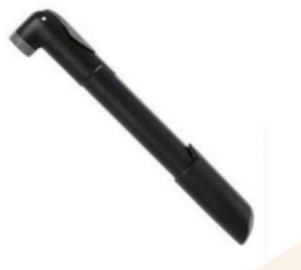
Figura 7 - Ilustração da mini bomba manual.

3.1.34.2. Mini Bomba Manual: Com bico reversível, válvula grossa (tipo americana ou Schraeder ), com tubo de plástico reforçado, com alavanca de travamento com o polegar, preferencialmente na cor preta.