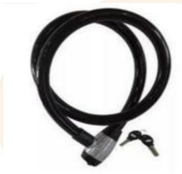
Figura 6 - Ilustração do cadeado de trava de cabo de aço.