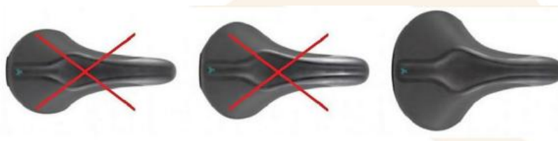
Figura 5: Ilustração do selim.