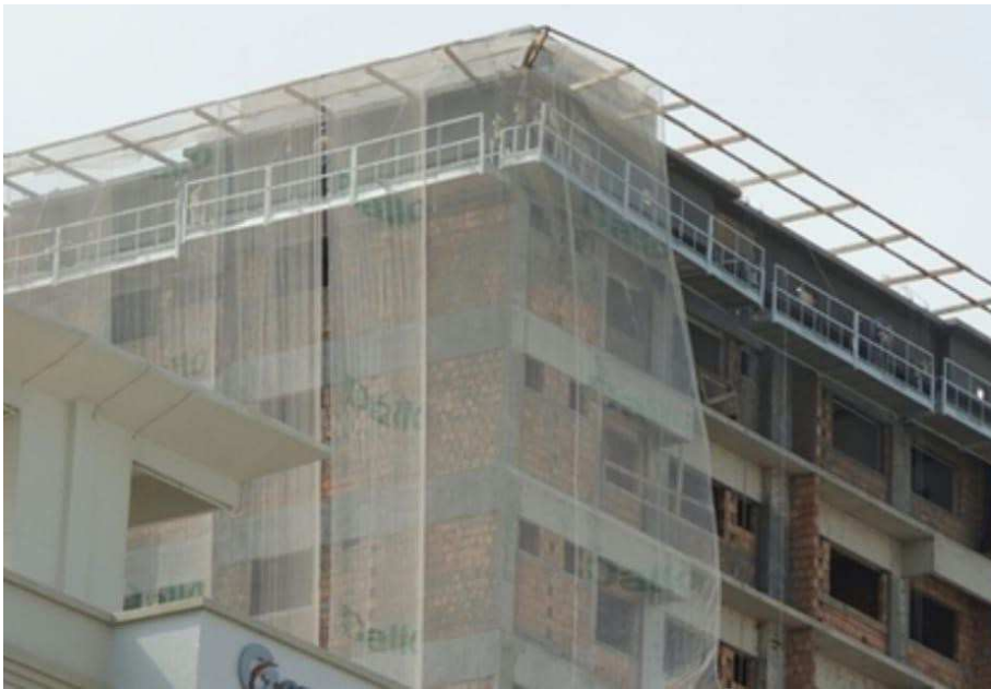
Figura 1: modelo de estrutura metálica de afastamento

12.4.24.11.2. A confecção de cavaletes metálicos para sustentação de balancins.