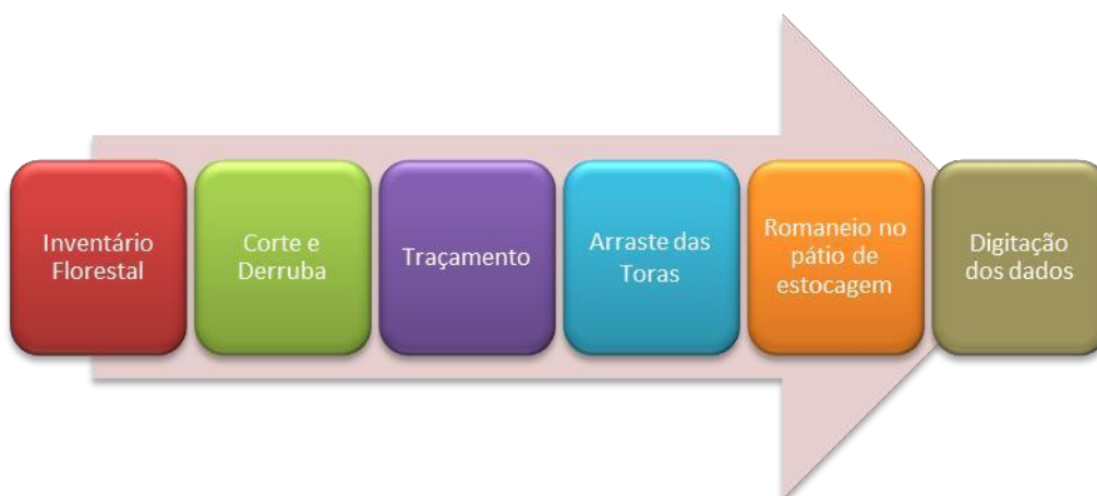
Figura 2: Atividades que participam do controle e monitoramento da cadeia de custódia da madeira.

Para o rastreamento da madeira nas diversas etapas do manejo, serão desenvolvidas algumas atividades que visam garantir o controle de toda a cadeia da madeira desde a árvore que será explorada até a saída da unidade de processamento industrial.